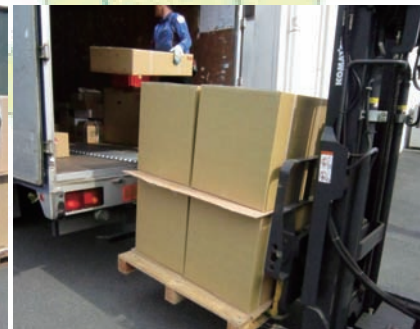
4月29日全数の出荷を完了