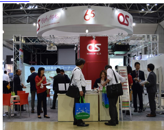
昨年出展時の様子