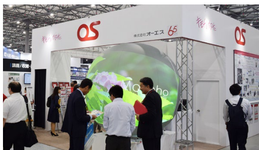
前回出展時の様子