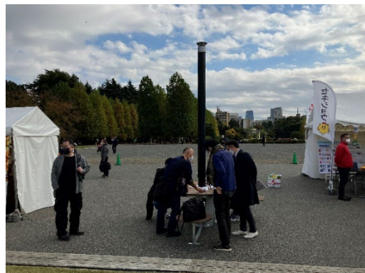
前回出展時の様子