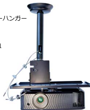
小型プロジェクターハンガー ユニバーサルタイプ 天井直付け HPC-010U1W-B11