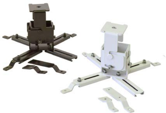
取付金具（ユニバーサルタイプ）