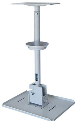
スラブ取付パイプ（取付ベースタイプ） HPC-010W1W-D11（パイプ長 400mm）