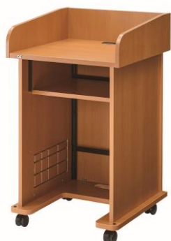
ウッド・底板足入れタイプ・扉なし CMA-03UM1-N06F（お客様組立） CMB-03UM1-N06F（完成品出荷） ※