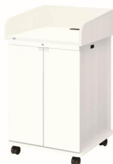
ホワイト・底板足入れなしタイプ・木扉 CMA-16UW1-W06N（お客様組立） CMB-16UW1-W06N（完成品出荷） ※