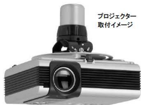
プロジェクター 取付イメージ